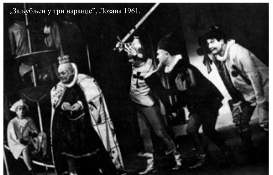
„Заљубљен у три наранџе“, Лозана 1961.