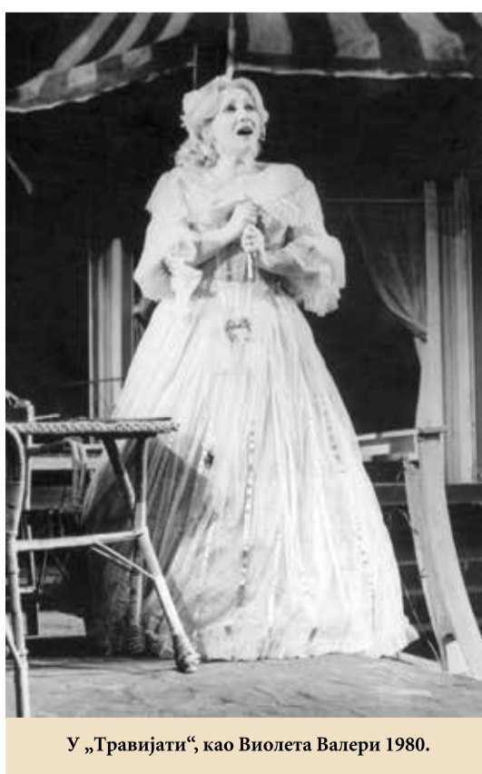
У „Травијати“, као Виолета Валери 1980.

Пошто је на сцени Народног позоришта у Београду у премијерним извођењима Гуновог „Фауста“ (1978), Вердијевог „Фалстафа“ (1978), Доницетијевог „Дон Пасквалеа“ (1979) и Бетовеновог „Фиделиа“ (1979), испољила своје добро позна-