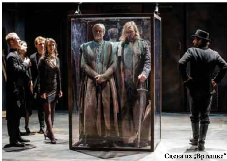
Сцена из „Вртешке“

Гостовање будимпештанског Националног театра увеличао је и долазак мађарског министра људских ресурса – проф. др Миклоша Кашлера (министар културе).