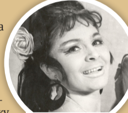
Чаробним гласом освојила свет: Бреда Калеф

ВИШЕ од три деценије, својим непресушним талентом, огромном харизмом и раскошним гласом меосопрана подједнако је освајала срца публике и стручне критике, суверено господарећи оперским сценама, не само у Србији и бившој Југославији, него и широм Европе и света. Ових дана, у миру и тишини свог стана, ушушканом у поткровљу стамбене зграде, смештене у једној престиничкој улици, неколико стотина метара изнад Славје, у разговору за „Позоришне новине“ евоцирала је тек део успомена из своје блиставе каријере током које је одиграла 61 премијерну улогу, и 710 представа у Београду и 242 на гостовању. Пре нешто више од два месеца, за Дан Народног позоришта - 22. новембар, одлуком управнице Иване Вујић, добила је Печат Народног позоришта и на тај начин, своју колекцију многобројних награда, обогатила још једним престижним признањем. „Пре десет година, за свој осамдесети рођендан добила сам Плакету Народног позоришта на којој је писало: Ово илустрације је ваш дом. Сада, за деведесети рођендан, добила сам Златну плакету - Печат Народног позоришта поводом којег сам допринела животу и раду Народног позоришта. Овај гест ми је дирнуо и, заиста, веома обрадовао, јер цео мој живот је био везан и уткан у Народно позориште. Волела сам своју професију и несесибино је давала и позоришту и публици. Много сам гостовала по свету, али сам се увек радо враћала својој кући и свом Народној позоришту“, у даху нам прича оперска дива, госпођа Бреда Калеф Симоновић.