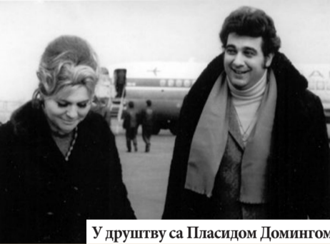
У друштву са Пласидом Домингом

„Откад знам за себе, увек сам певала. Глас сам наследила од мајке. Док сам живела у Господар Јовановићу улици, где сам и рођена, певала сам поред отворене