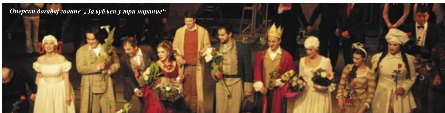
Оперски догађај године „Заљубљен у три наранџе“

Репризе: 24. мај, 31. мај, 9. јун, 28. јун 2011.