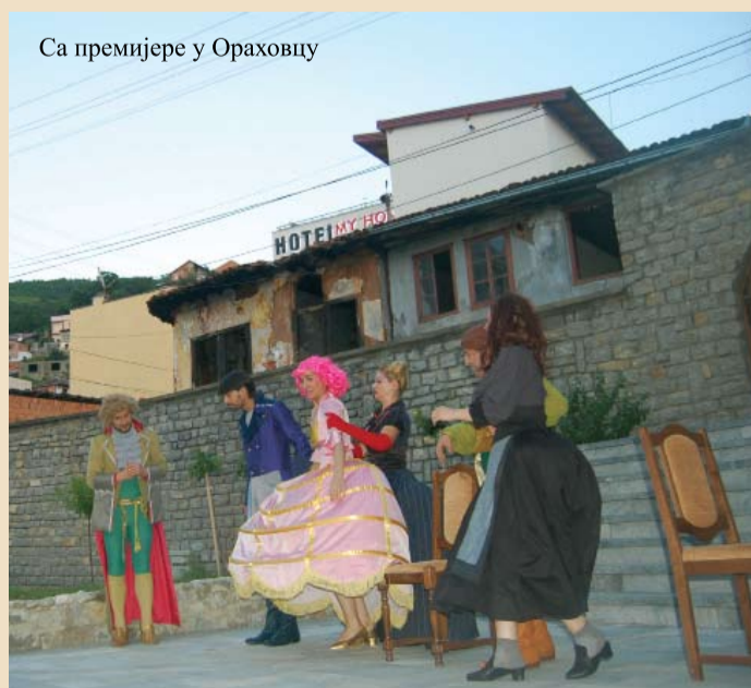
Са премијере у Ораховцу