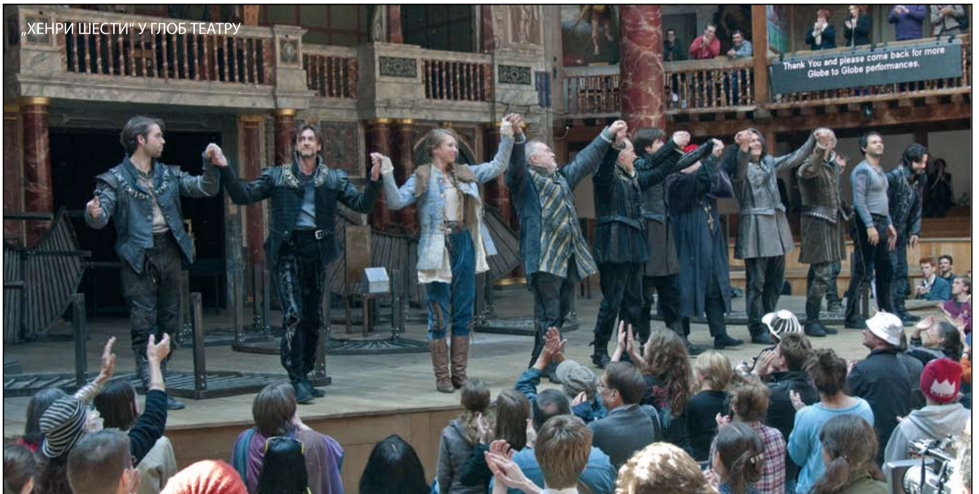
„ХЕНРИ ШЕСТИ“ У ГЛОБ ТЕАТРУ

ПРЕДСТАВОМ „ХЕНРИ ШЕСТИ“ ОТВОРЕНА 144. СЕЗОНА НАРОДНОГ ПОЗОРИШТА