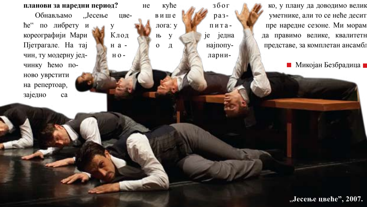
„Јесење цвеће“, 2007.