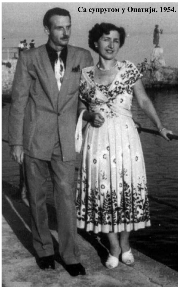
Са супругом у Опатији, 1954.

А Декер се заиста несребично трудио. Свом Београду је у више наврата приредио незаборавне тренутке изложбама цртежа и акварела, на којима су приказани или романтични предели пуни продоховљене животне истине или његове фантазије о васиони, женама... Његови цртежи су украшавали и многе листове и часописе (НИН,