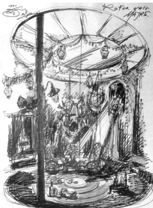
Кофер наше мајке, 1983.