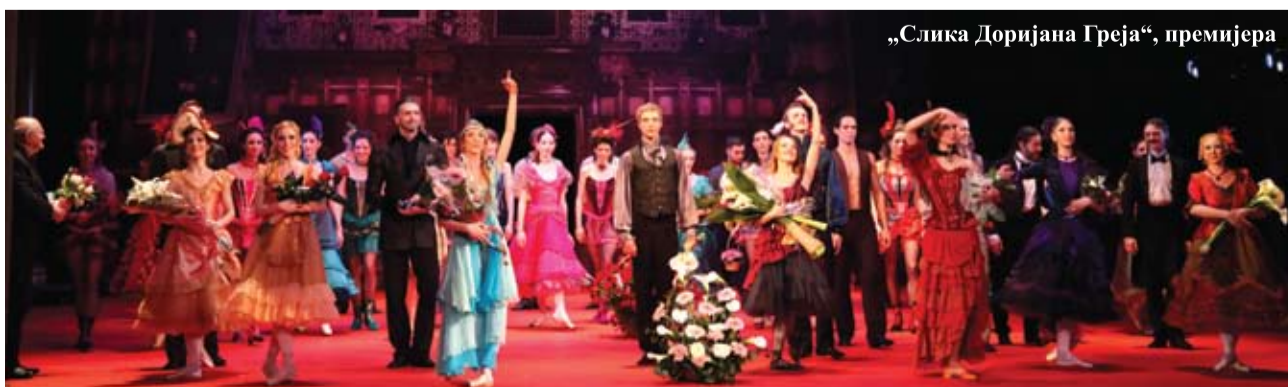
„Слика Доријана Греја“, премијера