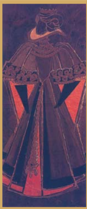
Костим за оперу „Ернани“, 1972.

Још за живота, донирали су свој богати стваралачки