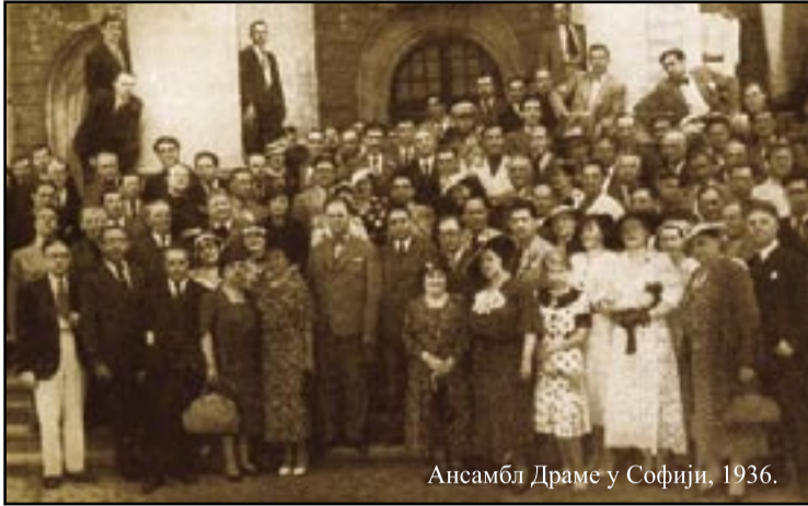
Ансамбл Дrame у Софији, 1936.