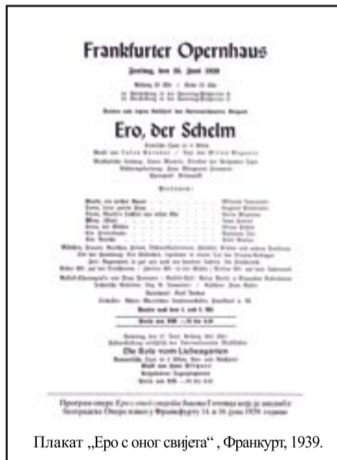
Плакат „Еро с оног свијета“, Франкфурт, 1939.

Када је на почетку сезоне 1919/20. званично основана Опера као самостални сектор Народног позоришта у Београду, Бинички је постављен за њеног првог директора и диригента. Између 1924. и 1935. године бројни руски уметници-емигранти (певачи, балетски играчи, редитељи, сценографи и костимографи) омогућили су тадашњем директору престоницке Опере, композитору и диригенту Стевану Христићу, да њен, углавном италијански репертоар, прошири и обогати руским операма, делима француских, немачких и наших оперских композитора, као и низом најзначајнијих остварења светске оперске класике. Даљем репертоарском, извођачком и музичком узлету београдске