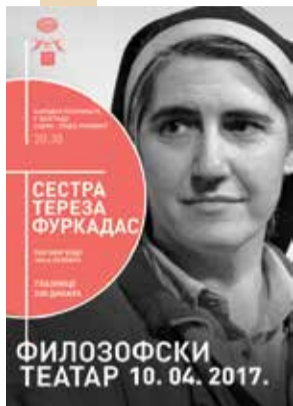
ФИЛОЗОФСКИ ТЕАТАР 10. 04. 2017.